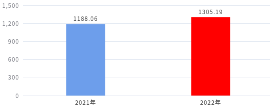
财政拨款支出对比图（单位：万元）