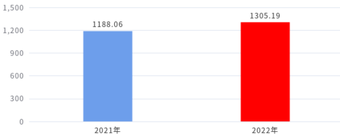
收入、支出决算总计对比图（单位：万元）

2022年度收入总计、支出总计均为1,305.19万元，与上年相比收入总计、支出总计均增加117.13万元，增长9.86%，增长的主要原因是：新招录人员以及应急管理、防灾减灾、安全生产等中心工作支出增加。