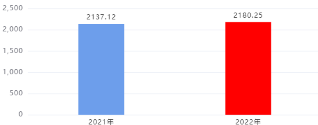
收入、支出决算总计对比图（单位：万元）

2022年度收入总计、支出总计均为2,180.25万元，与上年相比收入总计、支出总计均增加43.13万元，增长2.02%，增长的主要原因是：单位调入1人相应工资和福利支出增加。