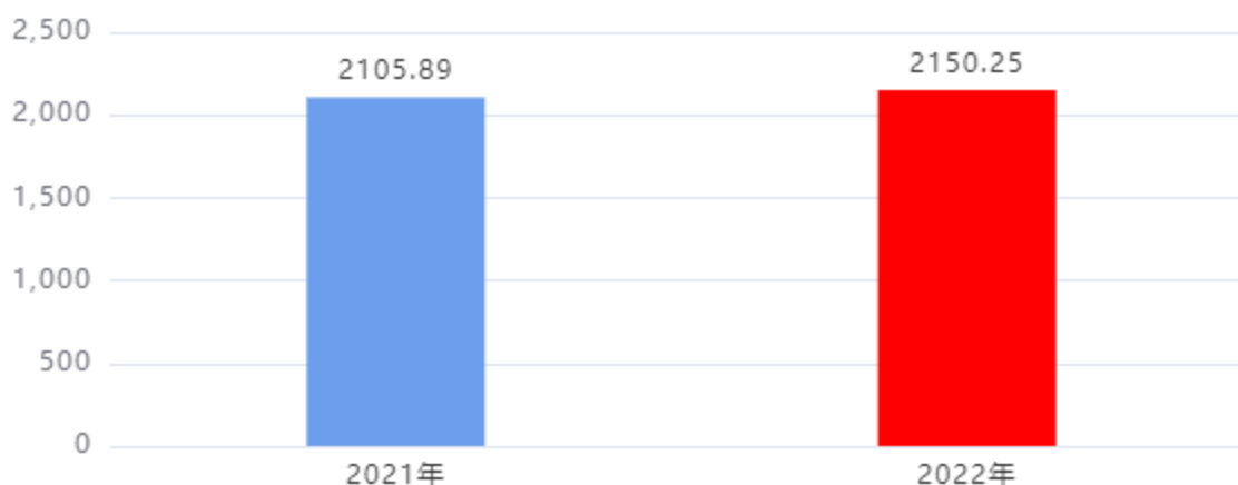
财政拨款支出对比图（单位：万元）