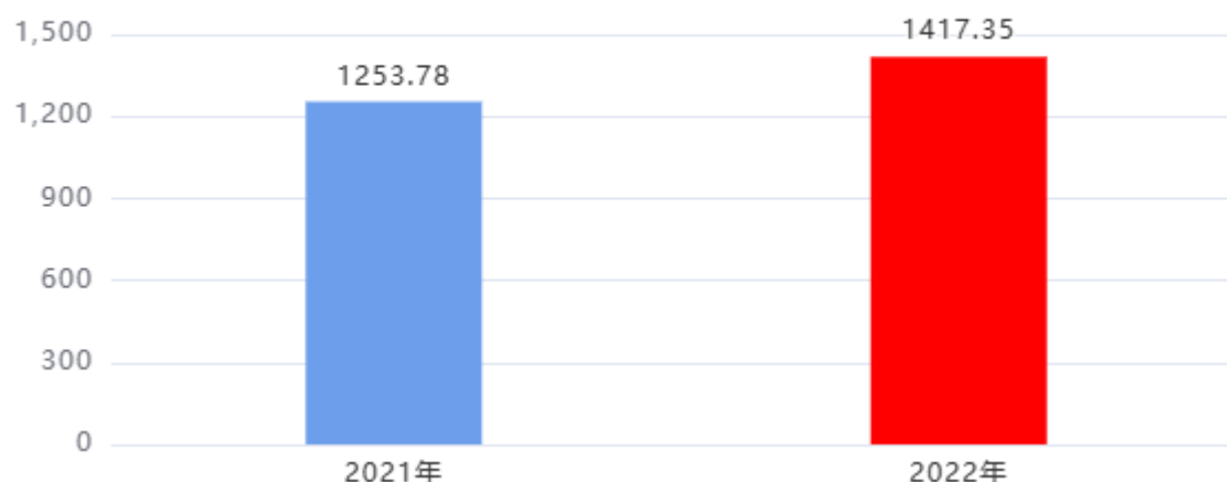
财政拨款收入、支出总计对比图 (单位：万元)

2022年度财政拨款收入总计、支出总计均为1,417.35万元，与上年相比收入总计、支出总计均增加163.57万元，增长13.05%，增长的主要原因是：人员工资福利支出增加。