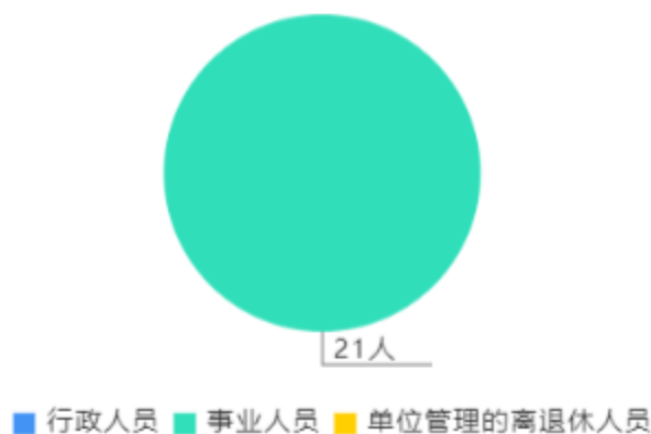
人员情况构成饼图

截止上年底，本单位人员编制26人，其中行政编制0人，事业编制26人；实有人员21人，其中行政0人，事业21人。单位管理的离退休人员0人。