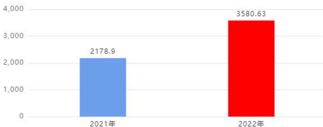
收入、支出决算总计对比图（单位：万元）

2022年度收入总计、支出总计均为3,580.63万元，与上年相比收入总计、支出总计均增加1,401.73万元，增长64.33%，增长的主要原因是：： 人员工资变化和重点项目（省级大型制造业研发经费投入奖补金，22年工业高质量发展奖补金，22年市工业中小企业发展专项资金，企业技术中心奖励金，省级中小制造业研发经费投入奖补金， 电子商务服务中心网络服务费，农商互联项目补助款，促销费稳增长项目奖励等）工作的开展。。