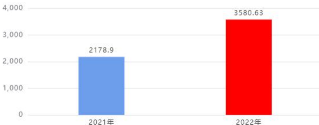
财政拨款支出对比图（单位：万元）