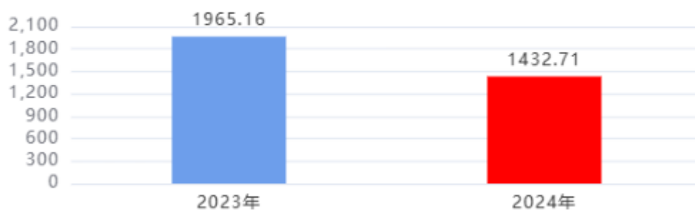
财政拨款收入、支出总计对比图 (单位：万元)

2024年度财政拨款收入总计、支出总计均为1,432.71万元，与上年相比收入总计、支出总计均减少532.45万元，下降27.09%，下降的主要原因是：本年度财政资金紧张基本公卫重大公卫项目收支减少，退休三人，人员经费减少。